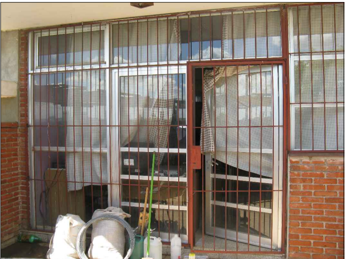
PUERTA VENTANA 2.60x3.15