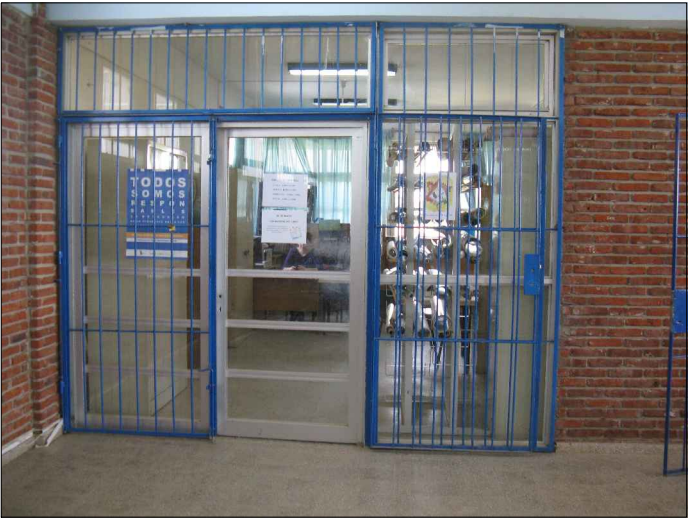
PUERTA VENTANA 2.60x3.20